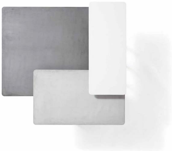
TABLE BASSE COFFEE TABLE